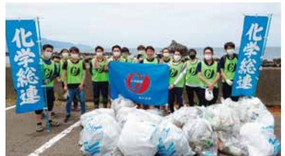
海岸清掃ボランティア